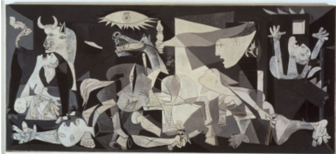
Pablo Picassos kunstneriske skildring af bombningen af Guernica 1937

Picassos subjektivitet udgør her objektivt en del af Europas betydelige kulturarv.